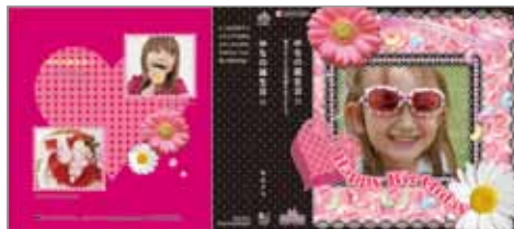
●ジェリービーンズ