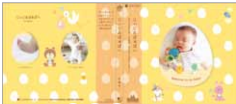
●たまご オレンジ 緑 桃 ↑この部分のカラーが選べます