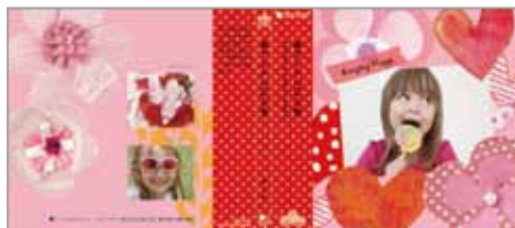
●コサージュハート